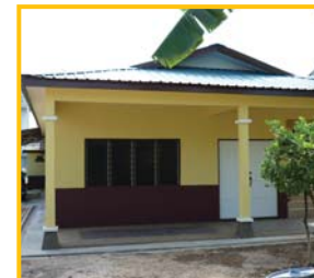
Fasa 2 - Ruangan Solat Wanita