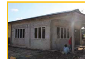
Pembinaan Fasa 2