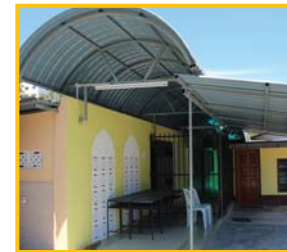
Fasa 1 - Tempat Wudhuk, Bilik Air, Pejabat, Pantri dan Laluan Tengah